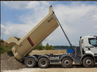
Don de matériaux