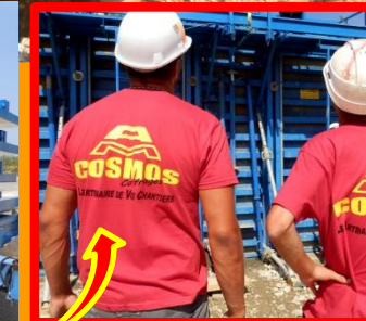
On saura le dire !