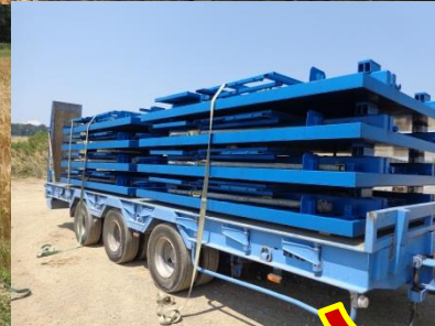
Location longue durée / gratuite