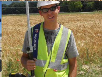
Mise à disposition de compétences