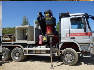
Repli de chantier